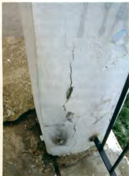
Ρωγμή λόγω διάβρωσης του σιδηροπλισμού

Ένα σύστημα θερμομόνωσης που θα εφαρμοστεί, μπορεί να χρησιμοποιεί διάφορα κατασκευαστικά συστήματα. Ένα από αυτά π.χ. θα μπορούσε να είναι ένας μεταλλικός σκελετός πακτωμένος σε διάφορες θέσεις του κελύφους του κτιρίου πάνω στον οποίο στηρίζεται το σύστημα της θερμομόνωσης. Ο μεταλλικός αυτός σκελετός που κατασκευάζεται κατ' αυτόν τον τρόπο και βρίσκεται κάτω από τη θερμομόνωση και είναι αφανής, μπορεί να δημιουργήσει στο κτίριο πλείστα όσα προβλήματα, είτε στα σημεία πάκτωσής του στα όποια (φέροντα και μη) στοιχεία του κελύ-