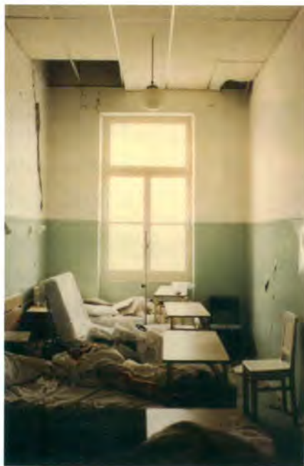
Πτώση ψευδοροφών πάνω σε κλίνες ασθενών σε Νοσοκομείο κατά τη διάρκεια σεισμού. Δεν υπάρχει προδιαγραφή για "αντισεισμική στήριξη ψευδοροφών".

στα στοιχεία (κολώνες – δοκάρια – προβόλους) από οπλισμένο σκυρόδεμα, βλάβες από καθιζήσεις του εδάφους θεμελίωσης, βλάβες από θερμοκρασιακές συστολοδιαστολές, βλάβες από προηγούμενους σεισμούς έστω και μικρής κάθε φορά έντασης (επειδή το φαινόμενο είναι