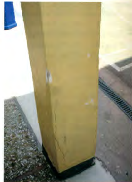
Ρωγμές λόγω διάβρωσης του σιδηροπλισμού

ναι ότι θα πρέπει η οποιαδήποτε νέα επένδυση γίνεται σε ένα τέτοιο παλιό κτίριο, αν δεν αποκαθιστά τα υπάρχοντα δομικά προβλήματα, τουλάχιστον να μη τα χειροτερεύει. Ένα απλό και γνωστό σε όλους παράδειγμα αυτής της κατηγορίας προβλημάτων είναι οι υπάρχουσες σήμερα πιλοτές σε κτίρια κατασκευασμένα πριν από το 1985. Εφ' όσον θερμομονωθεί το κελυφος του κτιρίου από τη στάθμη της οροφής της πιλοτής και πάνω και προστεθούν δυσκαμψίες και μάζες, εύκολα μπορεί κανείς – ακόμη και αν δεν είναι εξειδικευμένος τεχνικός επιστήμονας – να αντιληφθεί ότι σαφώς επιδεινώνεται το όποιο πρόβλημα πιλοτής υπάρχει. Θα μπορούσε κανείς, γι' αυτές τις περιπτώσεις, να φθάσει σε σημείο που να προτείνει να προηγηθεί η ενίσχυση της πιλοτής πρωτίστως και στη συνέχεια να φορτωθεί το κτίριο με το όποιο σύστημα θερμομόνωσης ήθελε επιλεγεί. Για την ενίσχυση της πιλοτής – εφ' όσον αυτή κρίνεται τεχνικώς απαραίτητη να γίνει – όπως έχουμε κατ' επανάληψη προτείνει μπορεί να γίνει πολύ απλά, οικονομικά και με υψηλή επιτελεστικό-