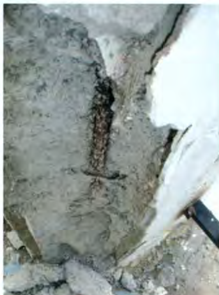
Μετά την αποκάλυψη του σιδηροπλισμού φαίνεται η διάβρωσή του