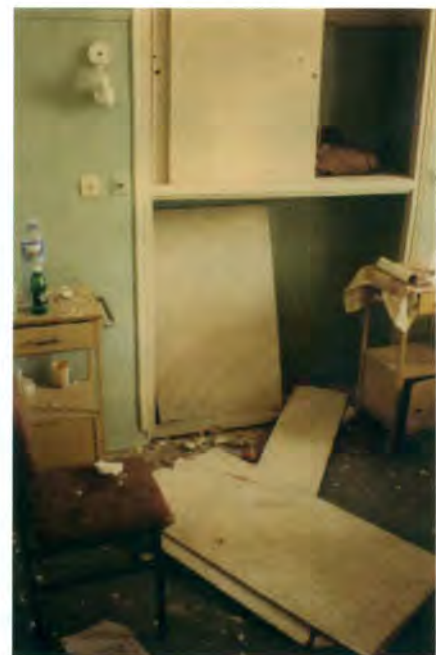
Κομμάτια ψευδοροφής στο πάτωμα θαλάμου ασθενών κατά τη διάρκεια σεισμού.

(*) Με ιδιαίτερη χαρά τα "Τ" φιλοξενούν αυτό το άρθρο του διακεκριμένου επιστήμονα και δασκάλου κ. Παν. Καρύδη. Το άρθρο αυτό νομίζουμε ότι δικαιώνει όσους υποστηρίζουν ότι κάθε επέμβαση στα κτίρια πρέπει να γίνεται μόνο από έμπειρους και με ευρύτητα γνώσεων τεχνικούς.