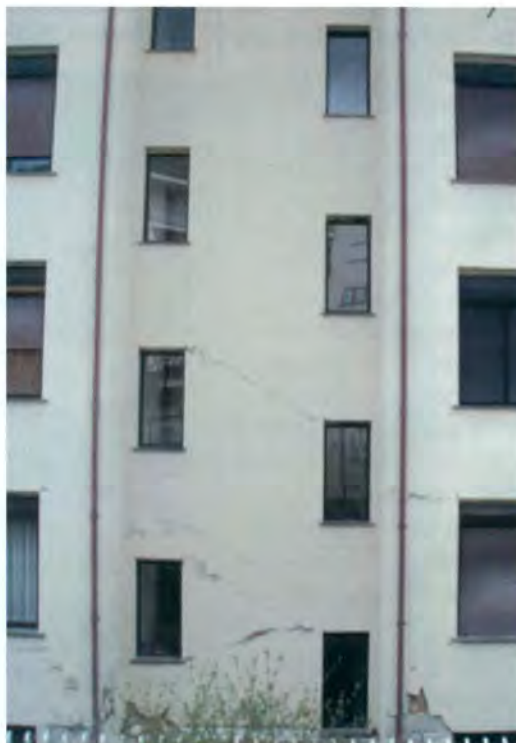
Ρωγμές από καθίζηση ή σεισμό