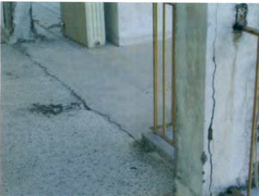
Ρωγμή λόγω διάβρωσης του σιδηροπλισμού

Η θερμομόνωση του τελευταίου ορόφου θα πρέπει να μη κρύβει τα προβλήματα από υγρασίες και διάβρωση του σιδηροπλισμού της πλάκας οροφής του τελευταίου ορόφου. Το πρόβλημα αυτό αφορά σε όλους τους ιδιοκτήτες του κτιρίου και όχι μόνον του τελευταίου ορόφου. Τα κτίρια της περιόδου πριν από το 1980 έχουν συνήθως πρόβλημα οξειδωσης του σιδηροπλισμού από υγρασίες που διεισδύουν από την ταράτσα. Ιδιαίτερα έντονα είναι τα προβλήματα όταν οι αντίστοιχες πλάκες είναι τύπου τσέλνερ (δηλαδή με διάτρητους οπτόπλινθους ανά αποστάσεις στις οποίες υπάρχουν διαδοκίδες από σκυρόδεμα με οπλισμό) πράγμα που είχε σχεδόν καθολική εφαρμογή την εποχή εκείνη. Ακόμη πιο προβληματική γίνεται η περίπτωση κατά την οποία συνηθιζόταν να τοποθετείται ένα